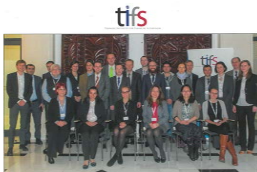
Përfaqësuesit e seminarit mbi vlerësimin e modeleve të brendshme

Iniciativa për Trajnimet në Mbikëqyrjen Financiare (TIFS) në bashkëpunim me Autoritetin e Mbikëqyrjes Financiare të Polonisë (PFSA) zhvilluan në datat 10-12 dhjetor në Varshavë seminarin “Vlerësimi i modeleve të brendshme: Qasje sasiore dhe cilësore”. Në këtë seminar merrnin pjesë aktuarë, ekspertë dhe drejtues të autoriteteve mbikëqyrëse në tregun e sigurimeve nga vende si: Azerbajxhani, Bosnje-Hercegovina, Republika Çeke, Danimarka, Finlanda, Hungaria, Lituania, Norvegjia, Sllovenia, Turqia, si dhe përfaqësues nga Autoriteti i Polonisë. Lektorë dhe prezantues në seminar ishin përfaqësues nga Autoriteti i Mbikëqyrjes Financiare të Polonisë, konsulentë të tregut të sigurimeve në Poloni, si dhe ekspertë nga Britania e Madhe. Seminari u fokusua kryesisht në përdorimin e teknikave dhe mjeteve mbikëqyrëse në analizën e supozimeve kryesore dhe kufizimeve të modeleve të rrezikut.